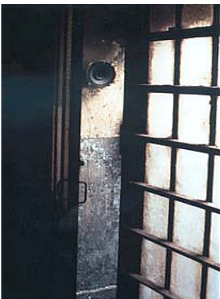
"mi-lieu" d'Eric La Casa